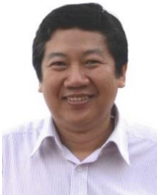
Ông Tổng Trưởng Thanh Trưởng phòng Công nghệ thông tin Saigonbank

NGÂN HÀNG TMCP SÀI GÒN CÔNG THƯƠNG (SAIGONBANK) là Ngân Hàng Thương Mại Cổ Phần đầu tiên được thành lập trong hệ thống Ngân Hàng Cổ Phần tại Việt Nam hiện nay, ra đời ngày 16 tháng 10 năm 1987, trước khi có Luật Công Ty và Pháp lệnh Ngân Hàng với vốn điều lệ ban đầu là 650 triệu đồng và thời gian hoạt động là 50 năm. Sau hơn 29 năm thành lập, SAIGONBANK đã tăng vốn điều lệ từ 650 triệu đồng lên 3.080 tỷ đồng. Tính đến năm 2016, SAIGONBANK có quan hệ đại lý với 641 ngân hàng và chi nhánh tại 75 quốc gia và vùng lãnh thổ trên khắp thế giới. Hiện nay SAIGONBANK là đại lý thanh toán thẻ Visa, Master Card, JCB, Union Pay... và là đại lý chuyển tiền kiều hối Moneygram.